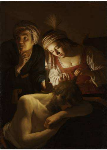
© The Cleveland Museum of Art. Mr. and Mrs. William H. Marlatt Fund 1968.23